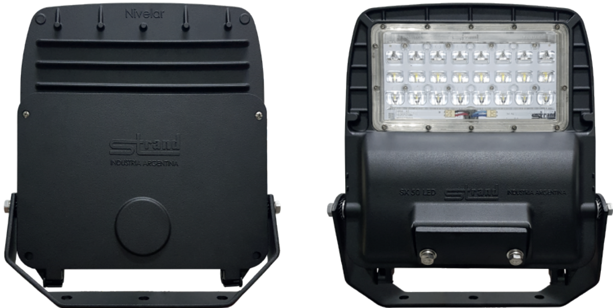
Foto de aplicación